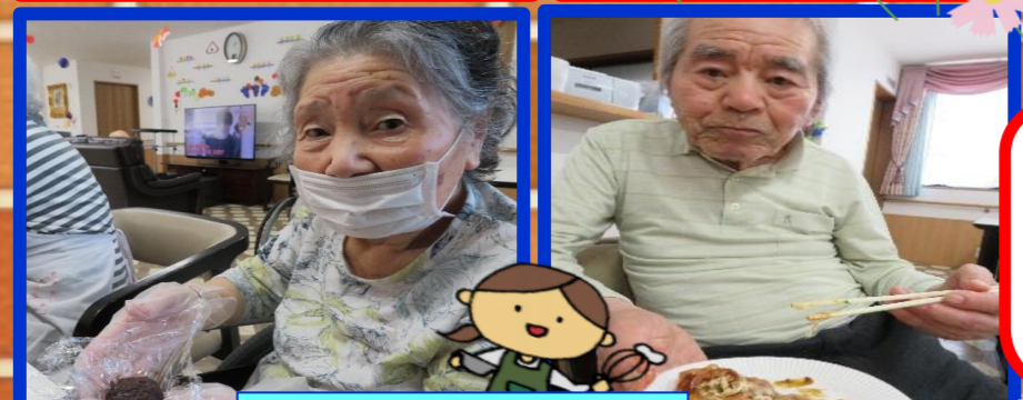
楽しいおやつ作り

この日は敬老会を行い、今年は古希・喜寿・傘寿を迎える方がおられ、皆様でお祝いを行いました。記念品贈呈と、紅白饅頭をお楽しみいただいた後は、立体神経衰弱ゲームや、職員からピアノで懐メロの演奏を贈らせていただきました。皆様いつまでも健やかに過ごしてくださいませ。