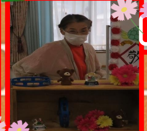
紅白饅頭が届きました(^^♪