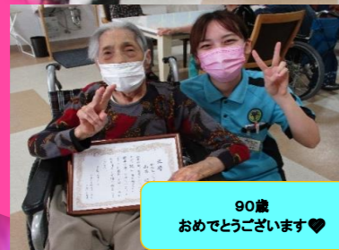
90歳 おめでとうございます