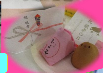
紅白饅頭 美味しそう