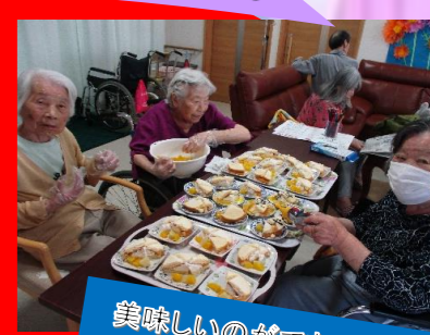
美味しいのができるよー