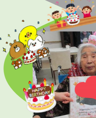
お誕生日おめでとうございます！ 素敵な1年を過ごしてください♪