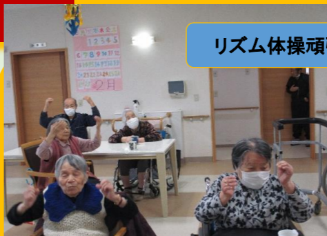
リズム体操頑張ってます🎵