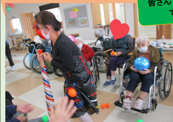
皆さんでボールを投げています！