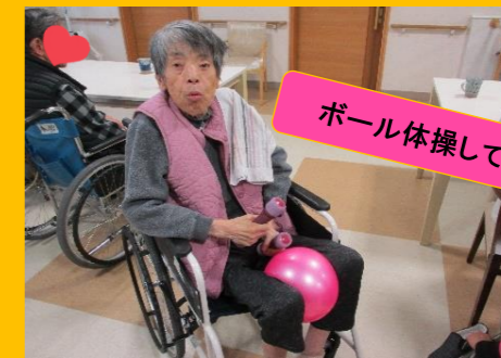
ボール体操しています🎵