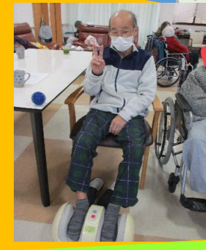
足のマッサージしてます