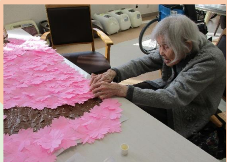
桜の花びらを作ってます！！