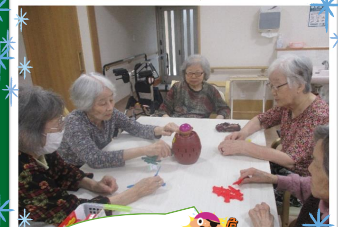
ゲーム大会も開催しています♪