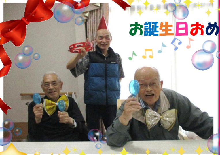
お誕生日おめでとうございます♪