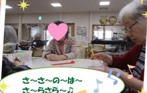
さ~さ~の~は~ さ~らさ~ら~♪