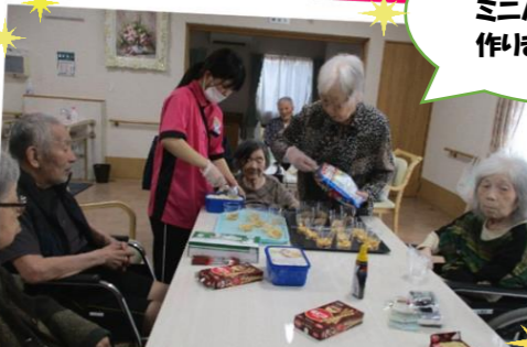
みんなでミニパフェを作りました♪