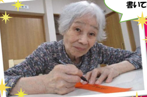
願いを込めて書いています…!