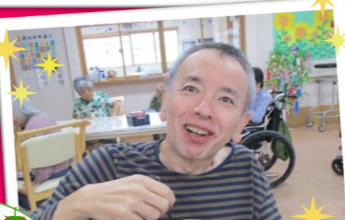
みんなで食べると美味しいですね♪