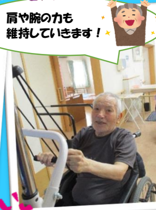
肩や腕の力も維持していきます!