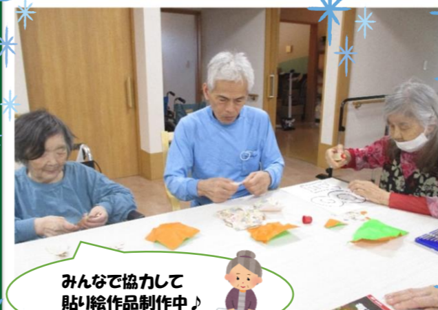
みんなで協力して貼絵作品制作中♪